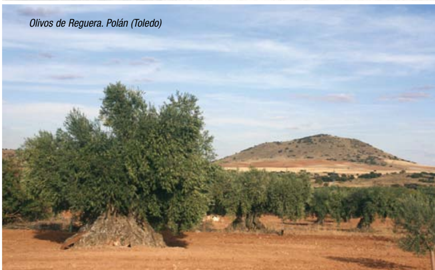
Olivos de Reguera. Polán (Toledo)

les. Abundan las encinas de gran porte y longevas en toda la provincia, los alcornoques en la Campana de Oropesa y los olmos en los núcleos de población, generalmente en la plaza de los pueblos, aunque algunos de estos ejemplares se encuentran en patios privados,