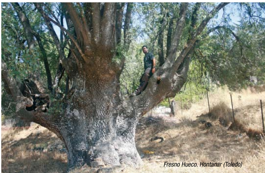
Fresno Hueco. Hontanar (Toledo)