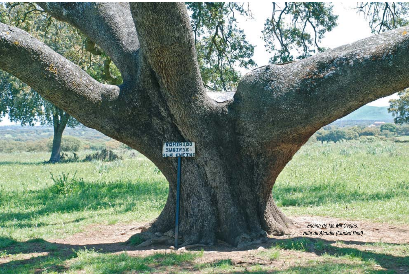
Encina de las Mil Ovejas. -Valle de Alcudia (Ciudad Real)