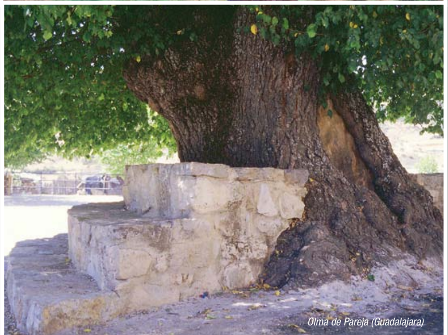
Olma de Pareja (Guadalajara)