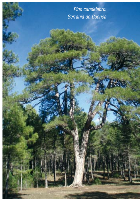
Pino candelabro. Serranía de Cuenca

el Capítulo I de Normas generales de la Ordenanza Municipal para la Protección de zonas verdes y arbolado urbano en Talavera de la Reina, aunque hasta hoy no existe ningún ejemplar declarado”.