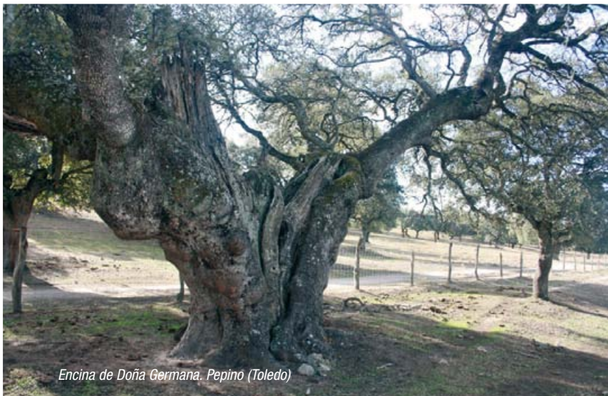
Encina de Doña Germana. Pepino (Toledo)