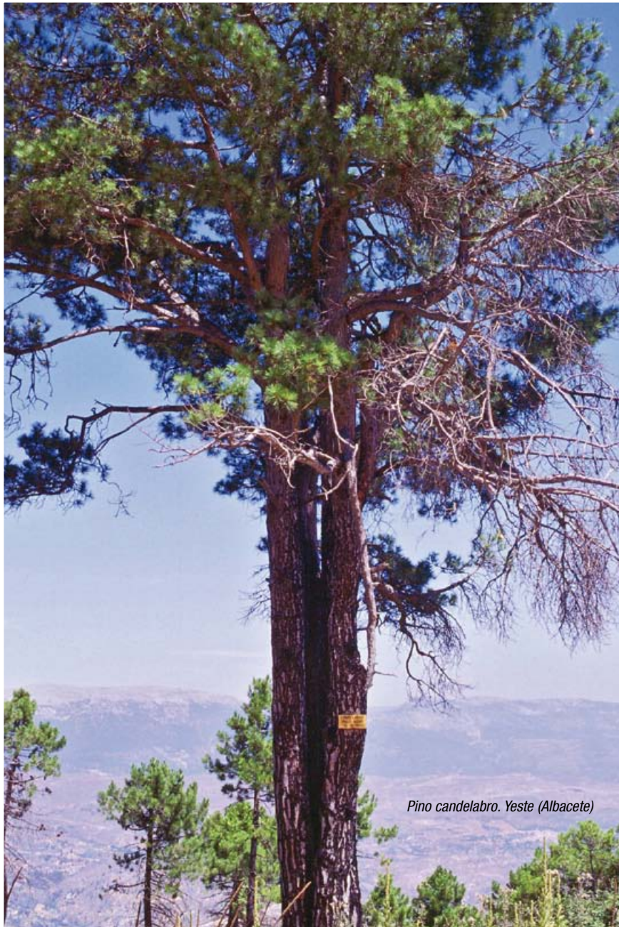
Pino candelabro. Yeste (Albacete)